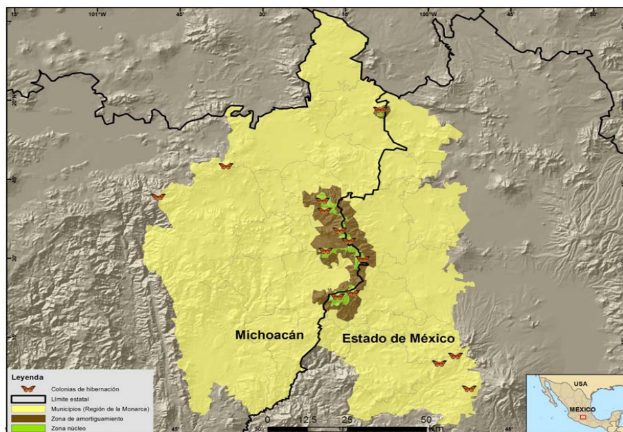
Fig. 1. Colonias de hibernación en la Región de la Monarca.

En 2000, el Fondo Mundial para la Naturaleza (WWF) y el Fondo Mexicano para la Conservación de la Naturaleza (FMCN), junto con el gobierno federal, los gobiernos de Michoacán y Estado de México, y la Fundación Packard, constituyeron el Fondo Monarca como estrategia de incentivos económicos para la conservación de los bosques de la zona núcleo. A los recursos financieros del Fondo Monarca se suman los del pago por servicios ambientales hidrológicos de la Comisión Nacional Forestal de la Secretaría de Medio Ambiente y Recursos Naturales, así como los apoyos de la iniciativa privada (en particular, la Alianza WWF-Telcel e Yves Rocher Francia-México) para proyectos sustentables, producción de planta, vigilancia forestal y reforestación, con los que se incrementan los beneficios económicos para los dueños de los bosques.