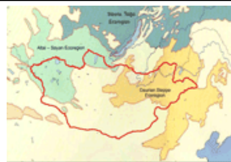
Зураг 1. Алтай-Соён ба Дагуурын хээрийн эко-бүс нутгууд

Манай дэлхийн байгаль экологийн тэнцвэртэй байдлыг хангахад хамгийн их ач холбогдол бүхий зайлшгүй хамгаалах 200 глобал эко-бүс нутгийг Дэлхийн Байгаль Хамгаалах Сан (WWF) тодорхойлон зарласан билээ. Энэ 200 глобал эко-бүс нутгийн хоёр нь болох Алтай-Соёны болон Дагуурын хээрийн эко-бүс нутгуудын зарим хэсэг манай Монгол оронд байдаг (Зураг 1). Дагуурын хээрийн эко-бүс нь Орос, Хятад, Монгол улсын нутаг дэвсгэрийг дамнан орших ба энэ эко-бүс нутагт Дагуурын ойт хээрийн, Монгол Манжуурын хээрийн гэсэн 2 дэд бүс багтана (Зураг 2).