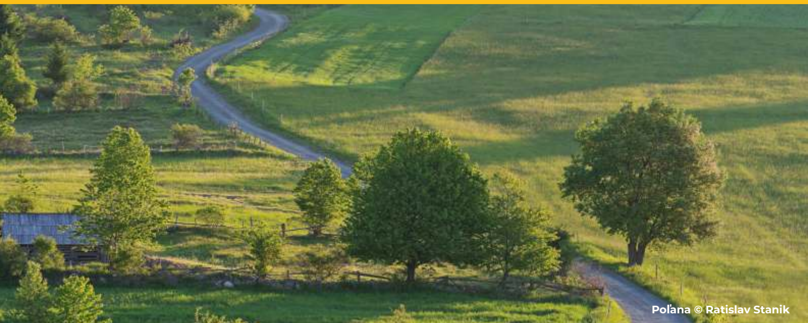
Polána © Ratislav Stanik