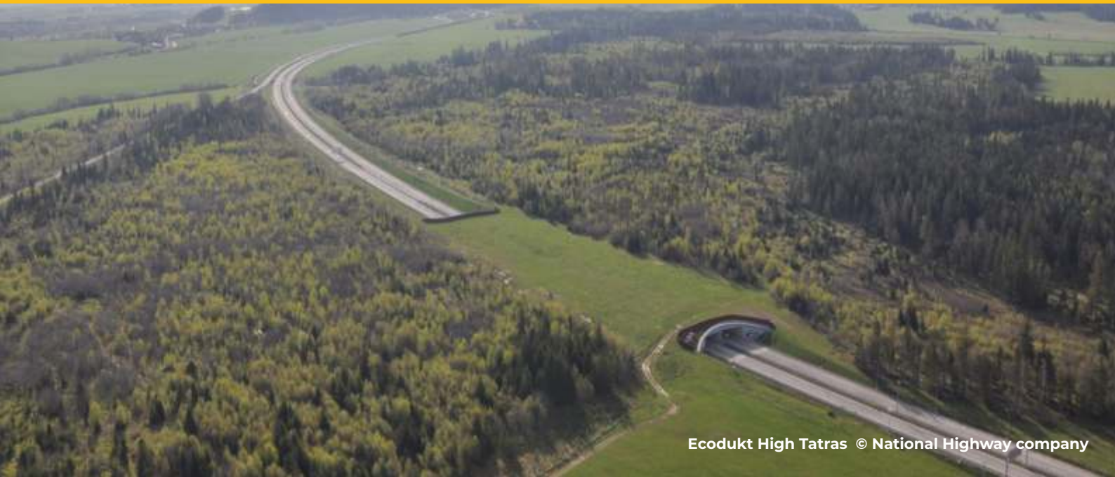
Ecodukt High Tatras