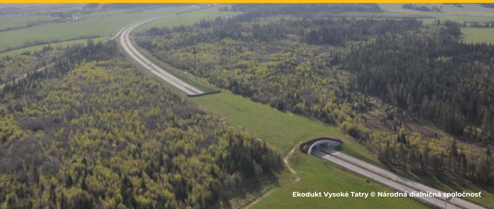
Ekodukt Vysoké Tatry