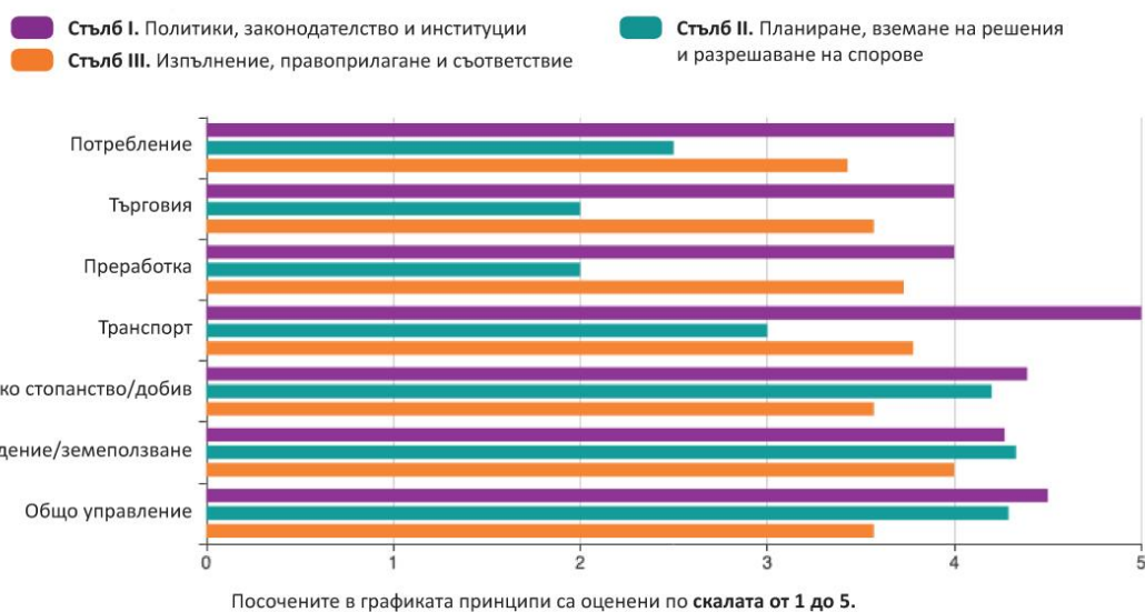
Графика 2: Резултати за всеки сегмент от веригата за устойчивостяване

Графиката показва някои интересни резултати. Вижда се, че представянето по стълб I е доста добро, без оценки под 4 от 5 и с резултат 5 за транспорт по стълб I. Това означава, че политиките, законодателството и институционалните рамки адресират доста последователно и по стабилен начин различните сегменти от веригата за устойчивостяване, въпреки че съществуват някои важни пропуски по специфични критерии, които ще доразвием по-долу. Интересното е, че стълб II показва най-слабите резултати за потребление , търговия , преработка и транспорт . Това се дължи главно на факта, че организациите на гражданското